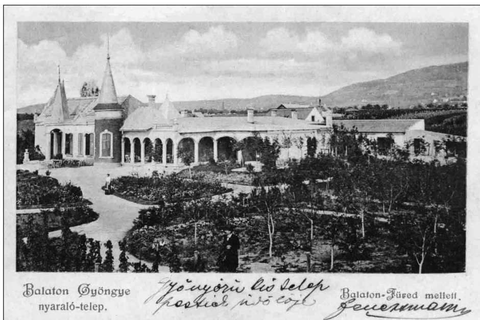
Balaton Gyöngye nyaraló-telep.

– Mindig mindent magának követelt, csak magának akart. Károly 1894-ben Tótvázsonyban született. Az elemi iskolát Pécsen kezdte, rokonoknál lakott: Tótvázsonyban nem volt hol tanulnia. Egy-egy évben két osztályt is vizsgázott ( két osztályt is elvégzett ), vágott az esze. Aztán ő is a veszprémi piaristákhoz került. Érettségi után Bécsben tanult tovább, közgazdaságot. 1918-tól 1933-ig külföldön élt. Pesten kezdett dolgozni, banktisztviselő volt, nem tudom, melyik pénzintézetnél. A cége Angliába küldte, ott bankfiókot vezetett, később ( ugyanennek a cégnek ) Törökországban majd Bulgáriában nyitott és vezetett bankfiókot. Angol, német, francia nyelven beszélt, bolgárul is megtanult. Azután Amerikában a Paramount filmgyárban lett üzletkötő: sok nyelvet beszélt, kiváló pénzügyi ismeretei voltak. Cukor hívta a filmgyárhoz: „Intézd az én levelezésemet, sokkal többet fizetek neked, mint a bank!” Az amerikai barátai még a háború után is fölkeresték,