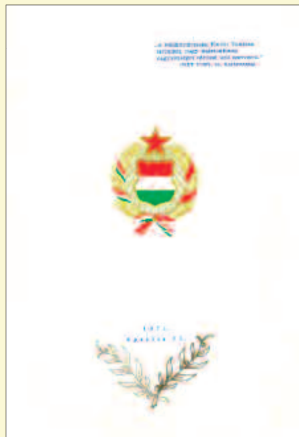
Dokumentumok a várossá nyilvánításról (1971)