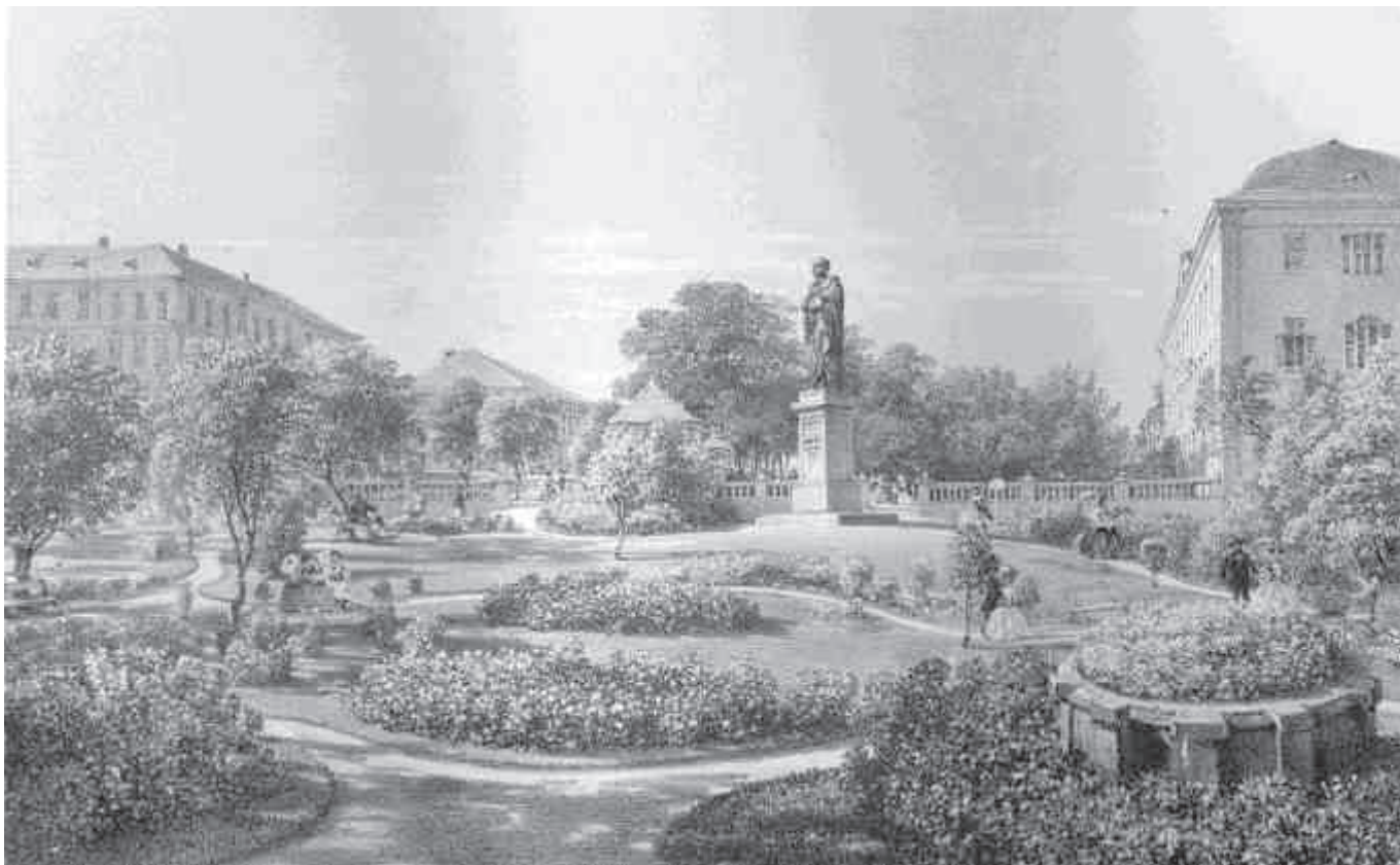
A füredi sétány részlete Kisfaludy Sándor 1860-ban avatott első szobrával